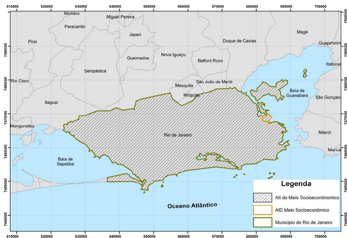
Figura III.2.2-1 – Área de Influência Indireta do Meio Socioeconômico

Pelo alcance da movimentação comercial decorrente da expansão dos terminais MultiRio e MultiCar, os dados relativos aos aspectos econômicos de mão de obra e tributação serão abordados dentro dos limites do município do Rio de Janeiro, onde estarão concentrados os serviços e atividades decorrentes das obras e os impactos inerentes à geração de empregos diretos, indiretos e tributos. A delimitação da AI do Meio Socioeconômico, equivalente aos limites municipais do Rio de Janeiro, é ilustrada na Figura III.2.2-1.